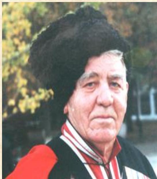
Почётный атаман Станицы Пашковской

Родился поэт в 1925 году. Детство его прошло в станицах Куцевской и Староминской.