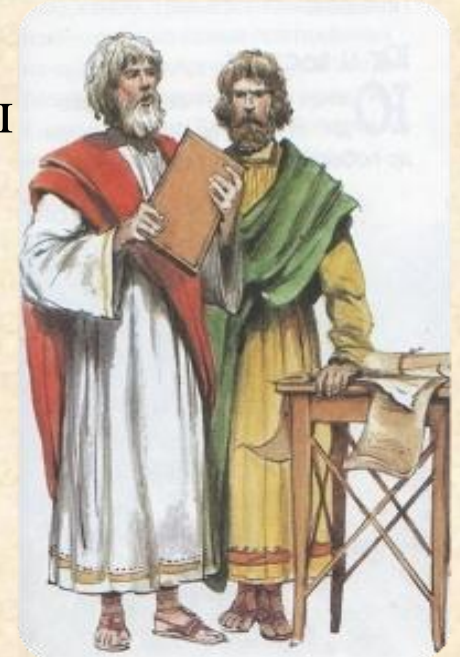
Братья Кирилл и Мефодий